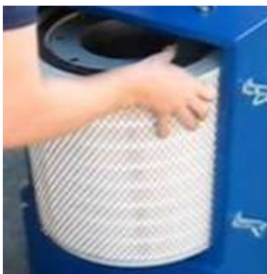
3- Retirer le filtre principal