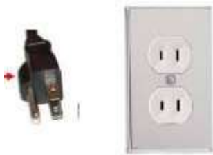
3- Brancher l'appareil