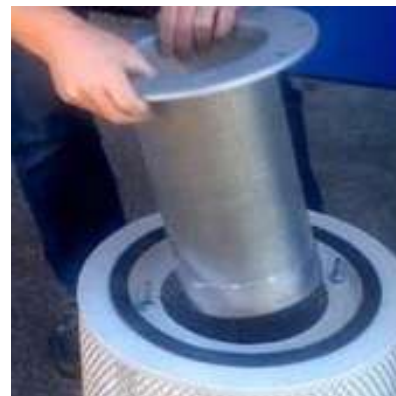
4- Retirer le filtre pare-étincelles