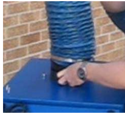
2- Placer la bande élastique