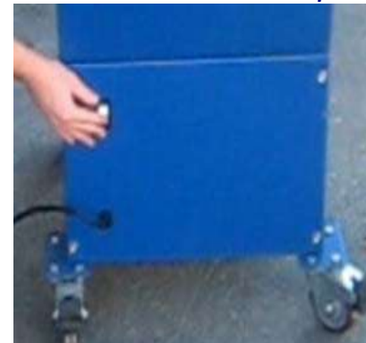
4- Démarrer l'appareil