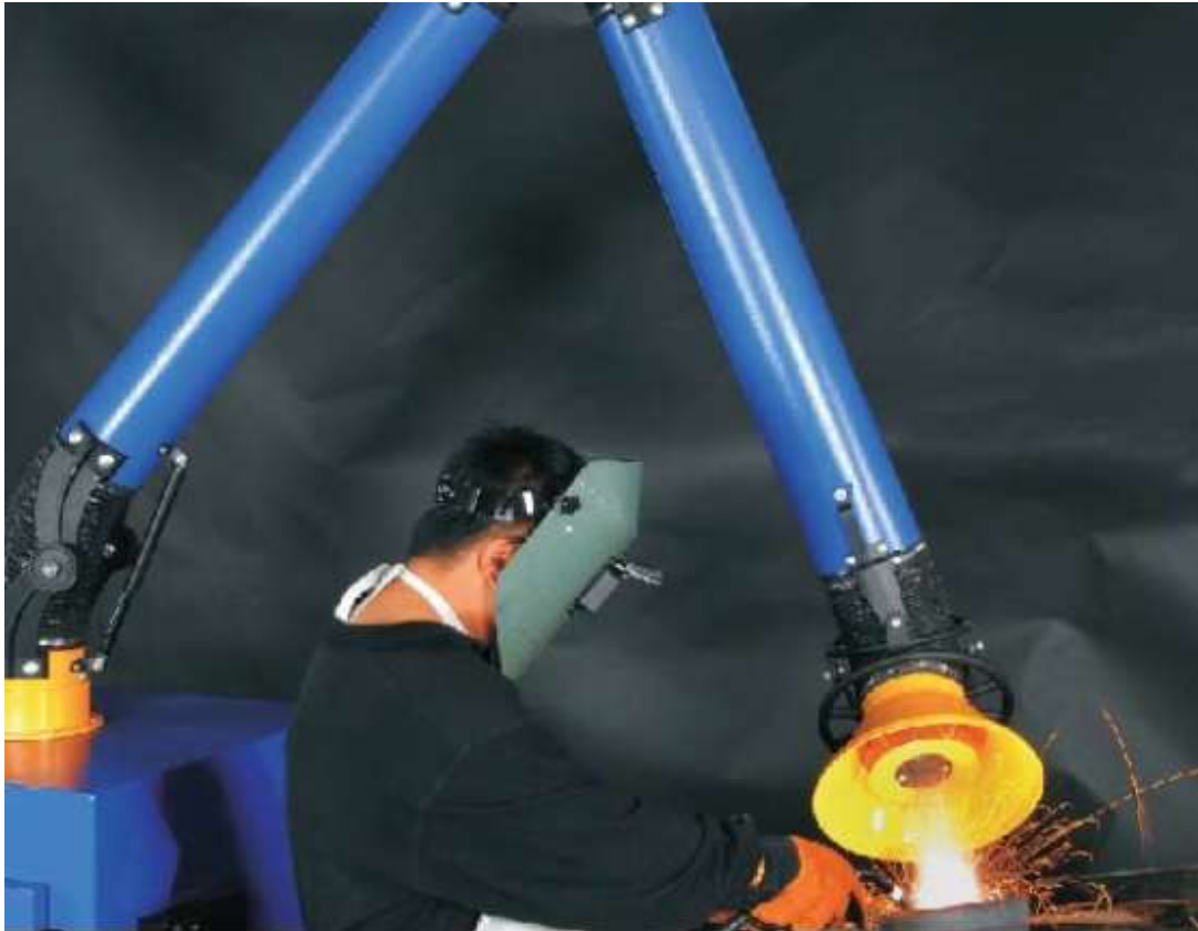
OPTION BRAS AIR-O-TUBE EN ACIER AVEC CAPTEUR MOBILE AIR-O-FUME