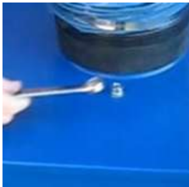
1- Desserrer les boulons de retenu