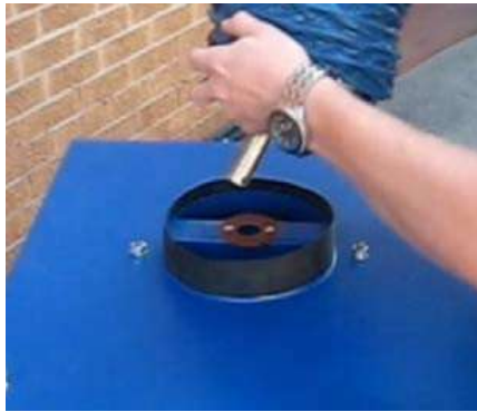
1- Placer le bras de captation