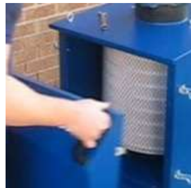
2- Ouvrer la porte d'accès